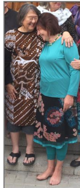
OGM Oktober 2018